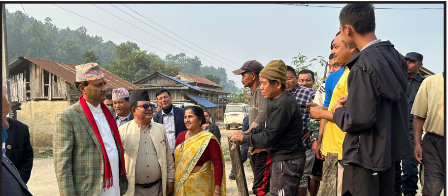
दुम्कीबास त्रिवेणी सडक खण्डका स्थानीयहरुसँग