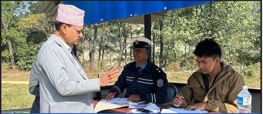
ट्रायल परीक्षा स्थल, बागलुङ्गको निरीक्षण