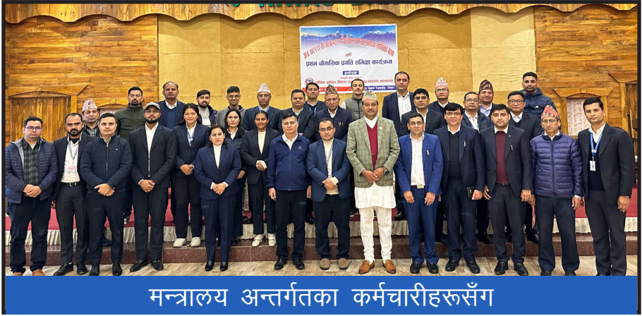
मन्त्रालय अन्तर्गतका कर्मचारीहरुसँग