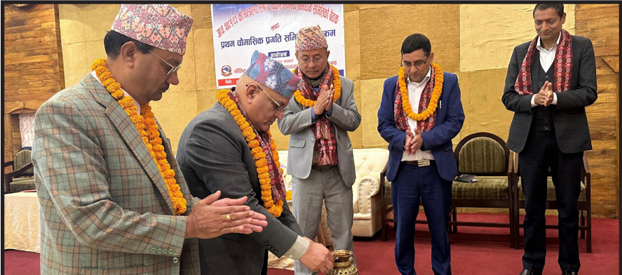
प्रथम चौमासिक प्रगति समीक्षाको उद्घाटन गर्दै मा.मुख्यमन्त्रीज्यू