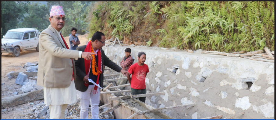
बिरुवा-किचनास-प्यारसिङ्ग-हरिनाश ग्रामीण सडक, स्याङ्जा