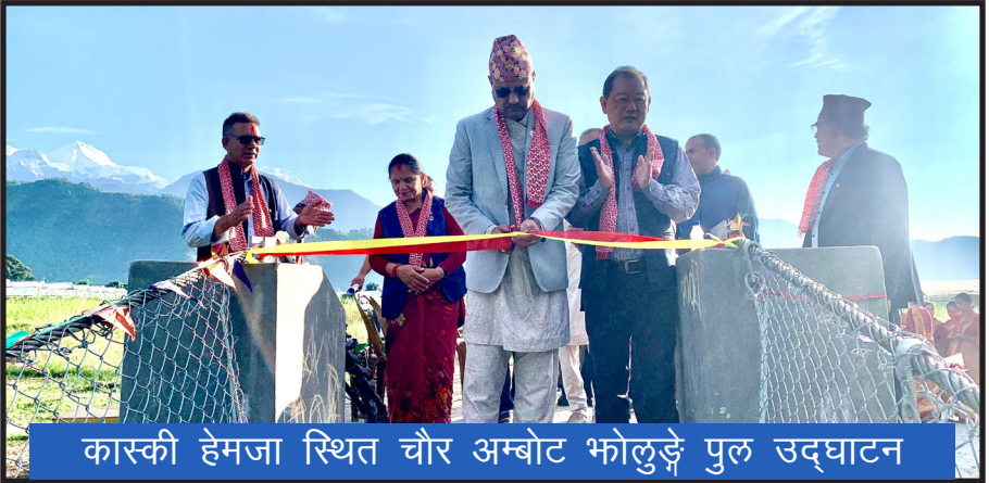
कास्की हेमजा स्थित चौर अम्बोट भोलुङ्गे पुल उदघाटन