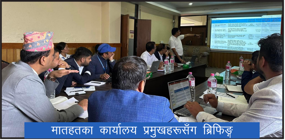
मातहतका कार्यालय प्रमुखहरूसँग ब्रिफिङ्ग