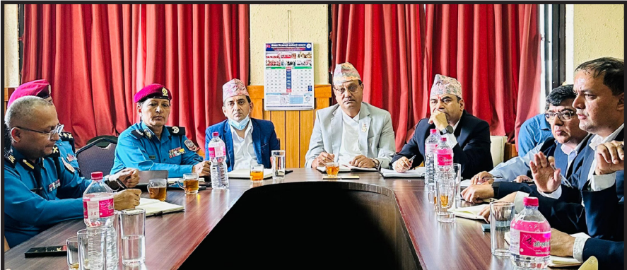
चाडपर्व लक्षित यातायात व्यवस्थापन सर्वपक्षीय बैठक