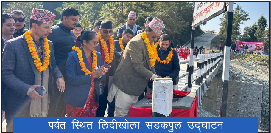
पर्वत स्थित लिदीखोला सडकपुल उद्घाटन