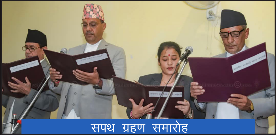
सपथ ग्रहण समारोह