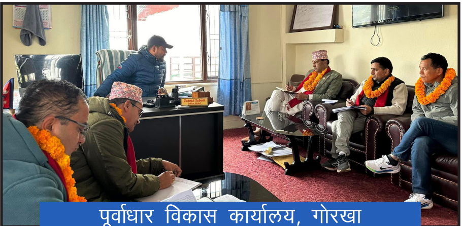
पूर्वाधार विकास कार्यालय, गोरखा