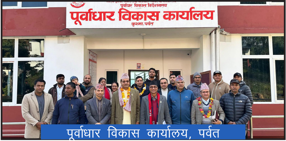
पूर्वाधार विकास कार्यालय, पर्वत